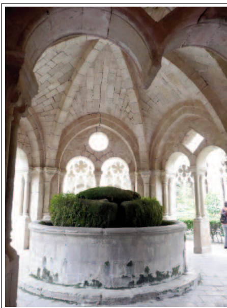
MONESTIR DE SANTES CREUS. Lavabo. Interior.

A l'interior destaquen el retaule barroc de 1646 i els dos panteons reials. El de Pere II el Gran, de finals del segle XIII, combina un templet gòtic amb un sarcòfag romà de pòfir, i als seus peus hi ha la tomba de Roger de Llúria. Aquest sarcòfag no fou profanat el 1835 i ha estat obert recentment per estudiar-ne les restes. A l'altra banda hi ha el panteó de Jaume II i Blanca d'Anjou, amb un templet similar però amb les estàtues jacents de la parella.