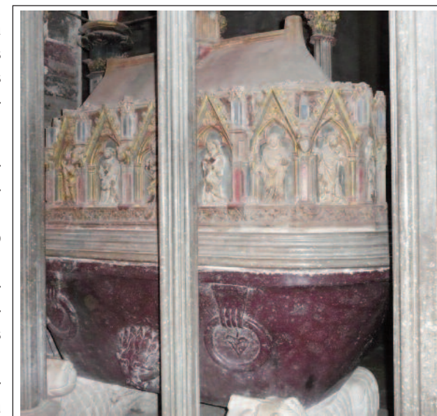
MONESTIR DE SANTES CREUS. Sepulcre del rei Pere II el Gran.

La sala capitular, iniciada a finals del segle XII, és un espai quadrat dividit en tres naus amb voltes de creueria i columnes de capitells vegetals. L'accés es fa per una porta d'arcs bessons flanquejada per finestres geminades amb arquivoltes. Al pis superior hi ha el dormitori, una nau molt allargada i ampla, il·luminada per fines-