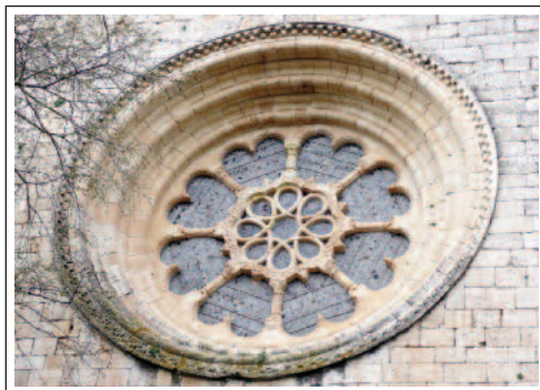
MONESTIR DE SANTES CREUS. Portal del claustre i Rosassa de l'església.