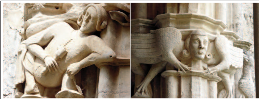
MONESTIR DE SANTES CREUS. Capitells del claustre. Detalls.

El palau reial, també del segle XIV, és un exemple notable d'arquitectura civil medieval catalana. Organitzat al voltant de dos patis i tres nivells, allotjava oficines, cavalleries i masmorra a la planta baixa; les cambres reials —després modificades pels abats— al primer pis; i el servei al segon. Un vestíbul enteixinat amb escuts reials i de l'abat Porta condueix al primer