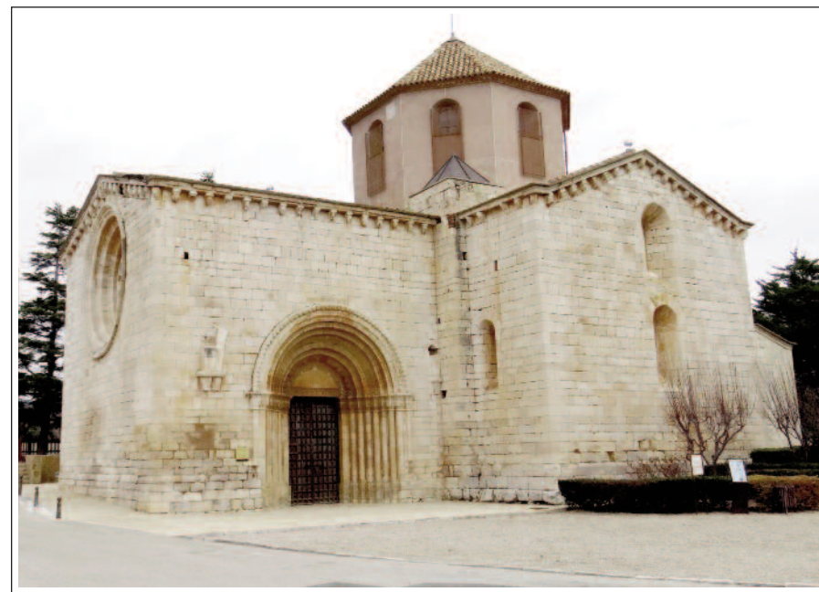
SANT RAMON DEL PLA DE SANTA MARIA.

Documentada des de finals del segle XII, ha rebut diversos noms al llarg del temps: Santa Maria del Pla, Villalba, Pla de Cabra i, des del 1953, Pla de Santa Maria. L'edifici més destacat és l'església romànica de Sant Ramon, situada a un extrem del poble. També sobresurten l'església parroquial barroca de l'Assumpció, la Cooperativa Agrícola, Ca la Marquesa, el grup d'habitatges de la fàbrica i la Casa Saperes. Conserven interès els portals medievals de la vila closa, el carrer Major amb cases pairals i portals de pedra, els arcs dels carrers de la Trinitat i del Roser i diversos casals amb