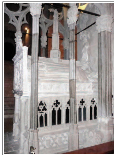
MONESTIR DE SANTES CREUS. Panteó de Jaume II el Just i Blanca d'Anjou.

tres ogivals i coberta per un sostre de dos vessants sostinguts per onze arcs diafragmàtics.