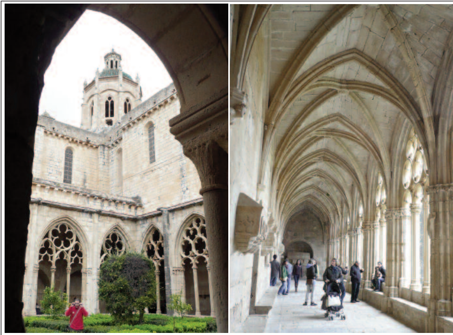
MONESTIR DE SANTES CREUS. Exterior i interior del claustre.

cos de guàrdia, la cuina, el refector, el palau reial antic, les estances dels monjos jubilats, la capella de la Trinitat i la infermeria.