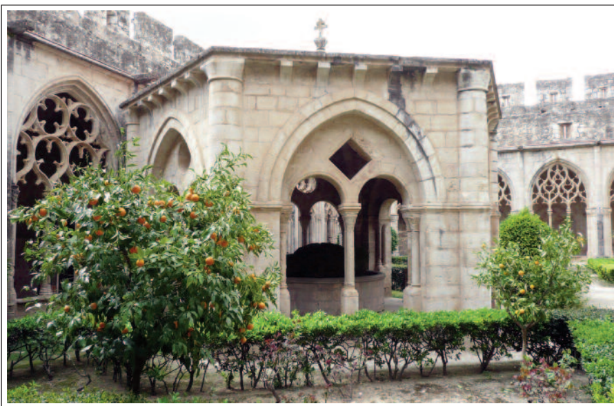
MONESTIR DE SANTES CREUS. Templet del lavabo. Al fons la galeria occidental del claustre.

Al segle XVI es construïren la torre de les Hores i la capella de l'Assumpta. Als segles XVII i XVIII, gràcies a la prosperitat agrícola, es bastí