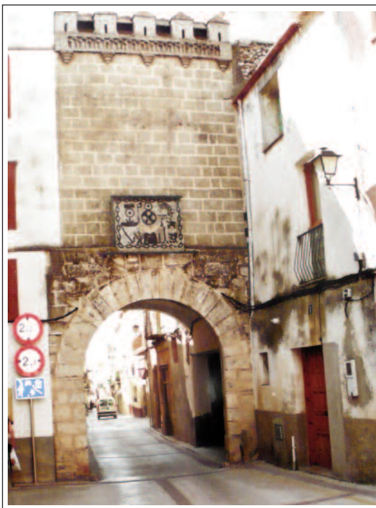
PLA DE SANTA MARIA. Portal de Cal Branca.

L'església de Sant Ramon està documentada des del 1194. Va ser malmesa durant la guerra dels Segadors i parcialment enderrocada, però la pressió veïnal en salvà la portalada. Inicialment dedicada a Santa Maria, passà a dir-se Mare de Déu del Roser i, al segle XX, Sant Ramon de Penyafort. Durant la Guerra Civil fou cremada i es perderen retaules i imatges. Declarada monument històric-artístic el 1951, fou restaurada entre 1985 i 1987. És un edifici de planta de creu llatina, nau única amb volta de canó apuntat, transsepte i