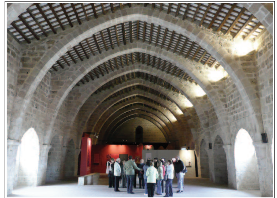
MONESTIR DE SANTES CREUS. Dormitori dels monjos.

L'església és de tres naus amb volta de creueria, separades per arcs formers sobre grans pilars rectangulars, i capçada per un transsepte amb cinc absis rectangulars, el central més gran. La façana oest presenta una portalada romànica amb arquivoltes i capitells esculpits, coronada per un