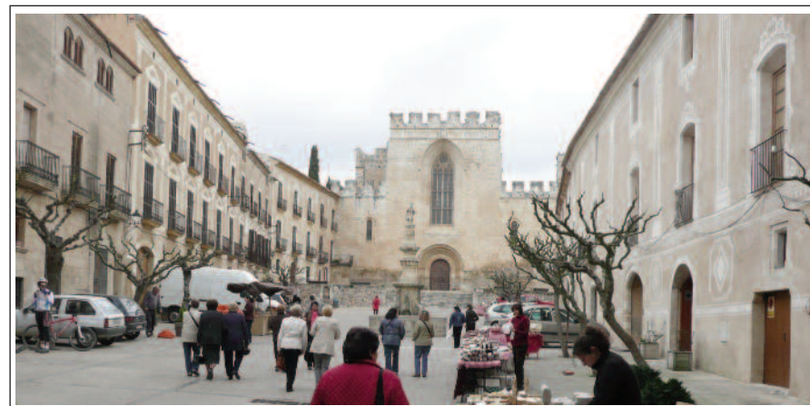
MONESTIR DE SANTES CREUS. Passeig d'entrada al recinte. Al fons l'entrada occidental de l'església.

El monestir de Santes Creus té el seu origen el 1150, quan els Montcada cediren al cenobi de la Gran Selva l'alou de Valldaura, on s'aixecà un primer monestir que aviat es demostrà inadequat, sobretot per manca d'aigua. La comunitat demanà un nou emplaçament a Ramon Berenguer IV, que els concedí l'Espluga d'Ancosa, però aquest indret tampoc no era apte i només s'hi construï una granja.